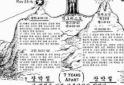
7 YEARS APART