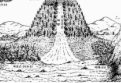
천년 왕국의 골짜기