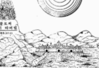
원전한 시대의 골짜기